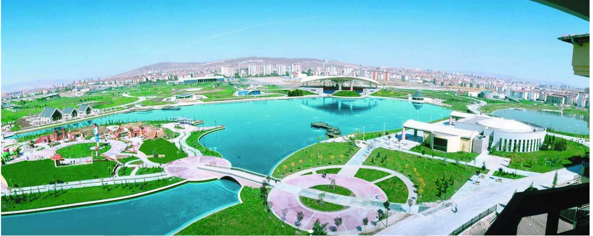
Sincan Harikalar Diyarı

Sincan İlçesinin geçirdiği kritik aşama, göç kültürü ile başlayan süreçtir. Bunun yanında sanayide önemli bir yere sahip olan organize sanayi bölgesinin kurulması da önemli bir kritik süreçtir. İlçe şimdilerde bir kırılma noktasından yukarı doğru çıkan eğilim içindedir.