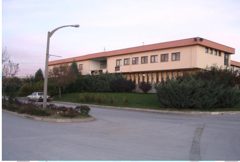
Erkunt Mesleki Eğitim Merkezi

Bakanlığına bağışlanarak 17.11.1996 tarihinde dönemin Cumhurbaşkanı Süleyman DEMİREL tarafından hizmete açılmıştır.