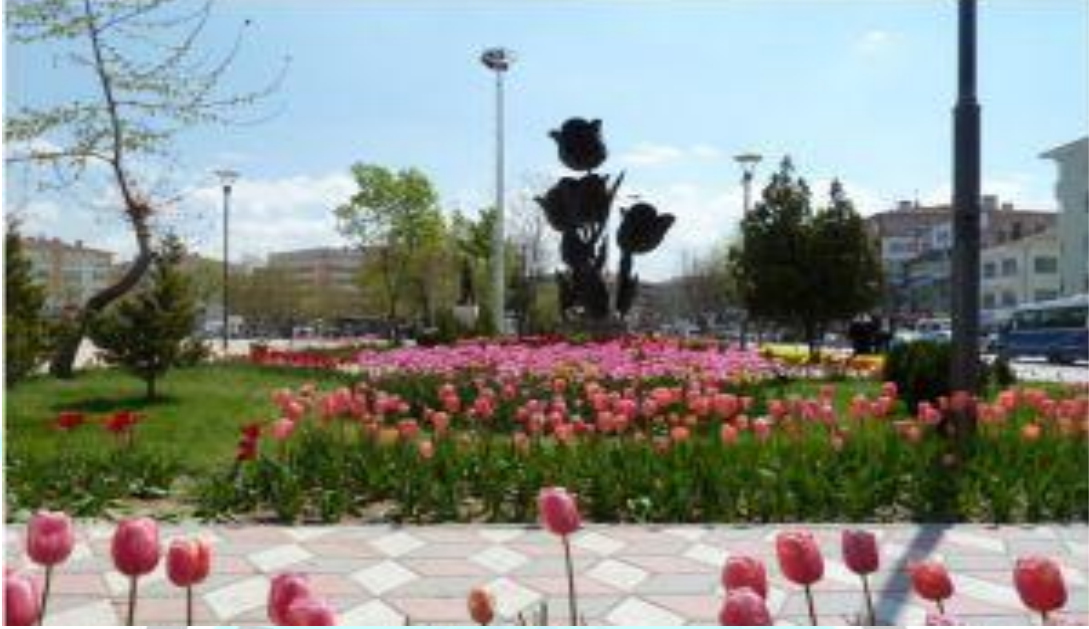
Sincan Lale Meydanı